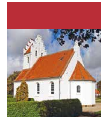
Vester Løve kirke