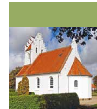
Vester Løve kirke